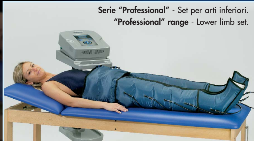
Serie "Professional" - Set per arti inferiori. "Professional" range - Lower limb set.