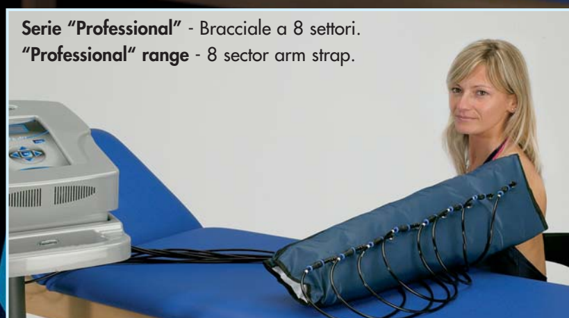
Serie "Professional" - Bracciale a 8 settori. "Professional" range - 8 sector arm strap.