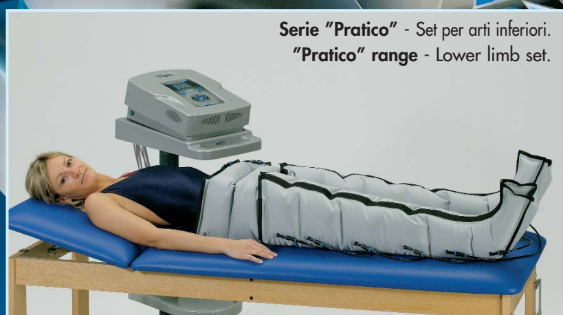
Serie "Pratico" - Set per arti inferiori. "Pratico" range - Lower limb set.